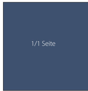
208 x 208 mm € 935,-

Platzierungswünsche: grundsätzlich unverbindlich, werden aber nach technischer und gestalterischer Möglichkeit berücksichtigt.