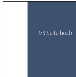
130 x 208 mm € 725,-