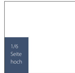
61 x 101 mm € 250,-